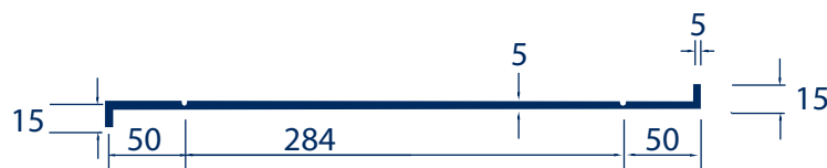
Aleta 5 mm